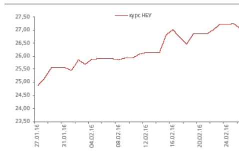
ОБМЕННЫЙ КУРС (грн/долл. США)

Объем остатков на корреспондентских счетах банков на прошлой неделе снизился и колебался в диапазоне 34-39 млрд грн. По состоянию на утро пятницы 26 февраля остатки составляли 34,5 млрд грн.